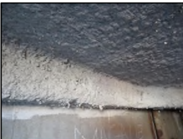
Photo N° 662 AMIANTE CIMENT -- LOCAL POUBELLE Conduits Ventilation haute (Fibres-ciment)

Dossier n°: 2013-09-300 FK DTA PC_070LAD_OPH