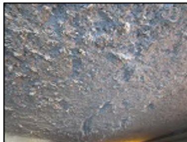
Photo N° 663 ECH-N°1 FLOCAGE -- LOCAL POUBELLE Plafonds Blanc cotonneux